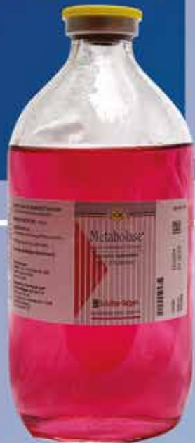
Metabolase® Registro Sagarpa Q-7804-024