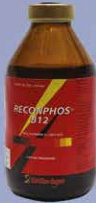
RECONPHOS® B12 Registro Sagarpa Q-7804-006

EL EQUIPO PERFECTO PARA LA SALUD DE SU GANADO