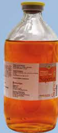
Superton® Registro Sagarpa Q-7804-091