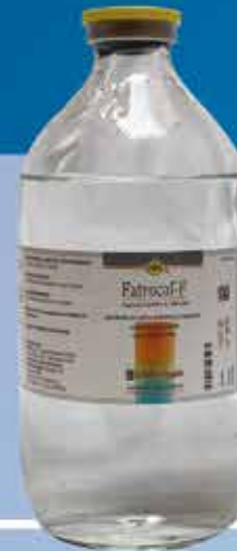
Fatrocal-F® Registro Sagarpa Q-7804-040